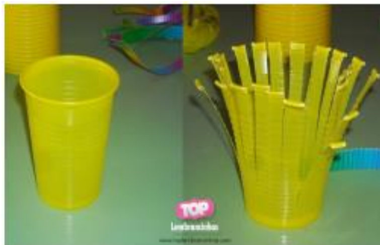
Figura 2 – Explicação sobre os vários usos dos descartáveis