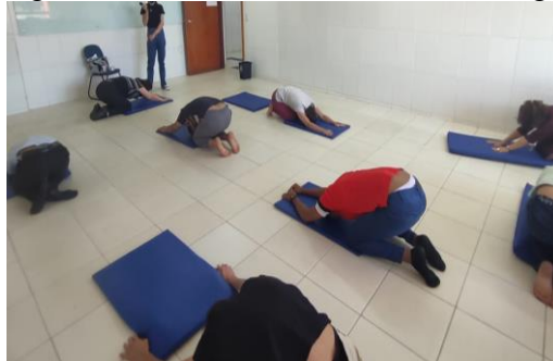
Figura 1 - Relaxamento através do Yoga

As figuras abaixo representam algumas posturas de yoga realizadas na oficina do corpo.