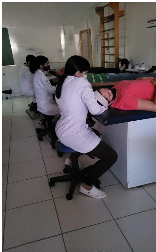
Figura 2 – Atuação dos estudantes