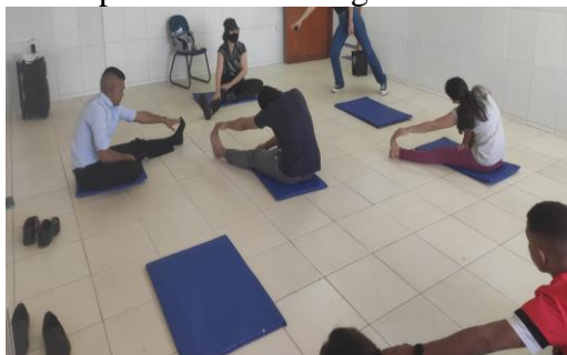
Figura 4 - Professora explicando a abordagem e exercícios de relaxamento.