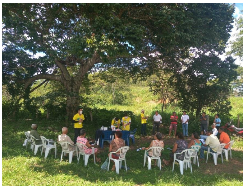
Figura 2 – Projeto Rondon na zona rural de Nova Roma

saúde, DST (doenças sexualmente transmissíveis) e IST (infecções sexualmente transmissíveis), testagem de pressão arterial, direitos das mulheres e crianças (violência sexual e trabalho infantil), mediação de conflitos e relacionamentos interpessoais, vacinação e prevenção, saúde feminina e inclusão na gestão municipal.