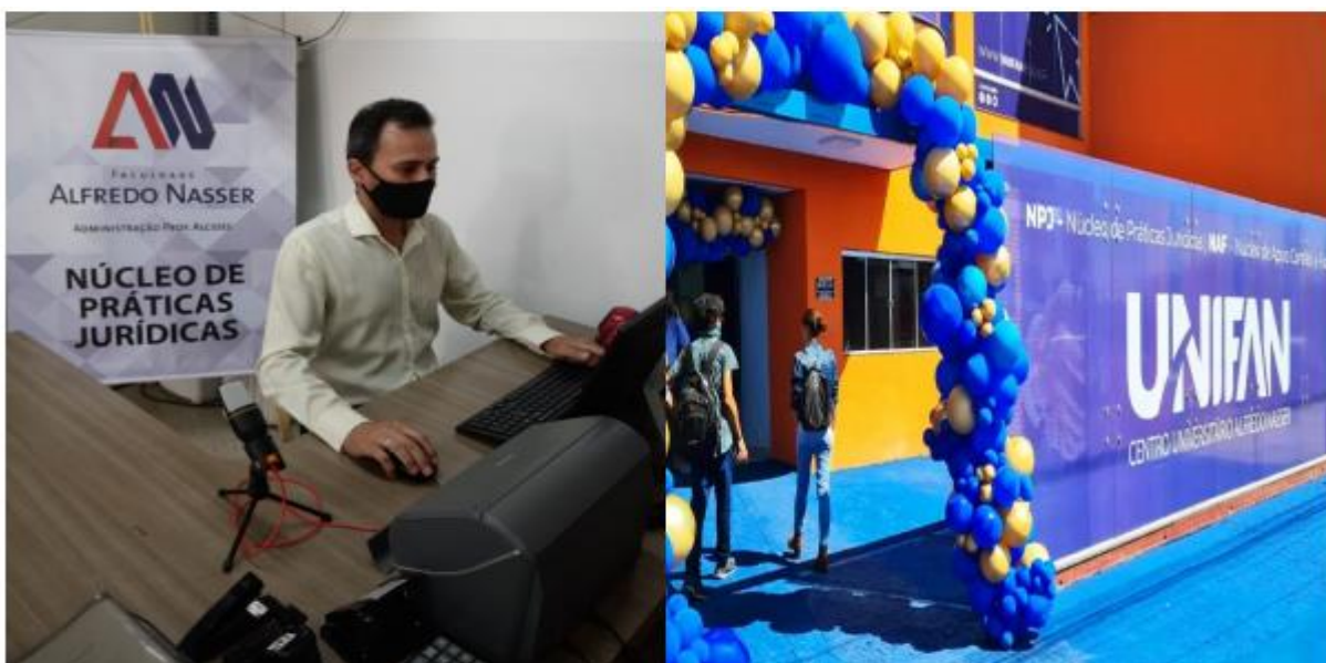
Figuras – Fotos das Ações do Núcleo de Práticas Jurídicas

No NPJ, os estudantes de Direito terão seus primeiros contatos com os sistemas judiciais, ou seja, são sistemas utilizados no dia a dia da profissão de um advogado. O NPJ propicia os primeiros contatos dos futuros advogados com clientes e a população carente que necessita de amparo legal e que não possui condições financeiras para pagar um advogado particular, através do NPJ, supre esta necessidade.