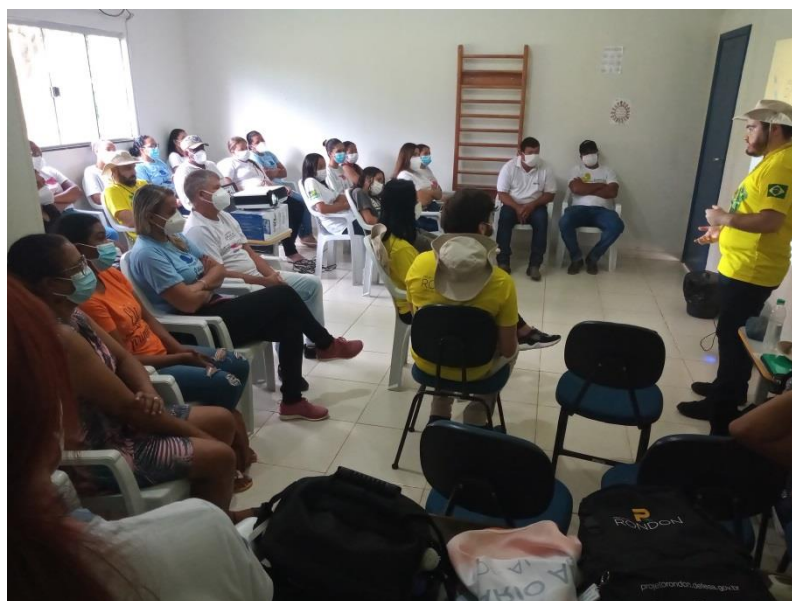
Figura 3 – Formação de agentes multiplicadores em saúde