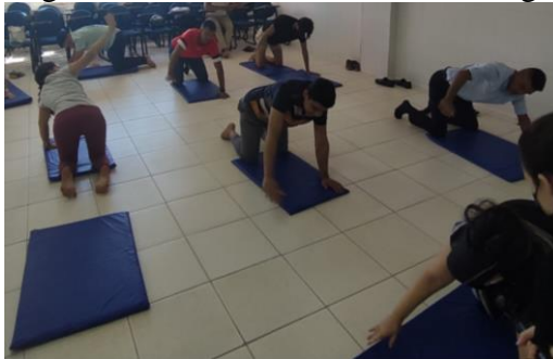
Figura 2 - Exercícios baseado no Yoga