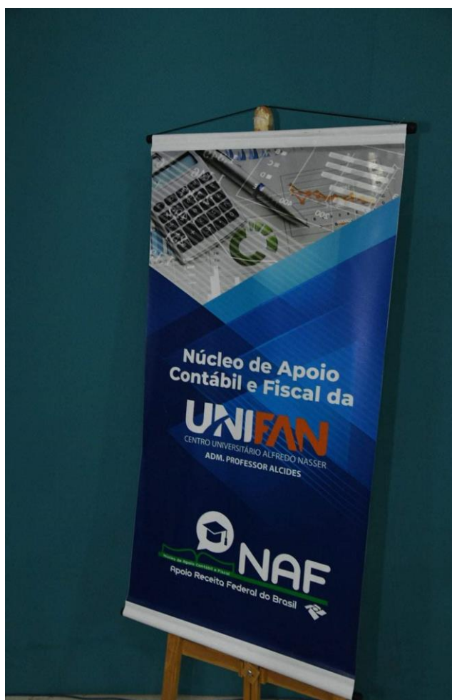
Figura 1 – Banner utilizado nas ações do NAF Unifan

Os atendimentos foram realizados tendo como espaço exclusivo para esta finalidade a sala dos professores da área de saúde, com a utilização dos computadores locais, de forma a permitir que os discentes prestassem os serviços ao público presente, contando com o suporte e orientação dos docentes envolvidos.