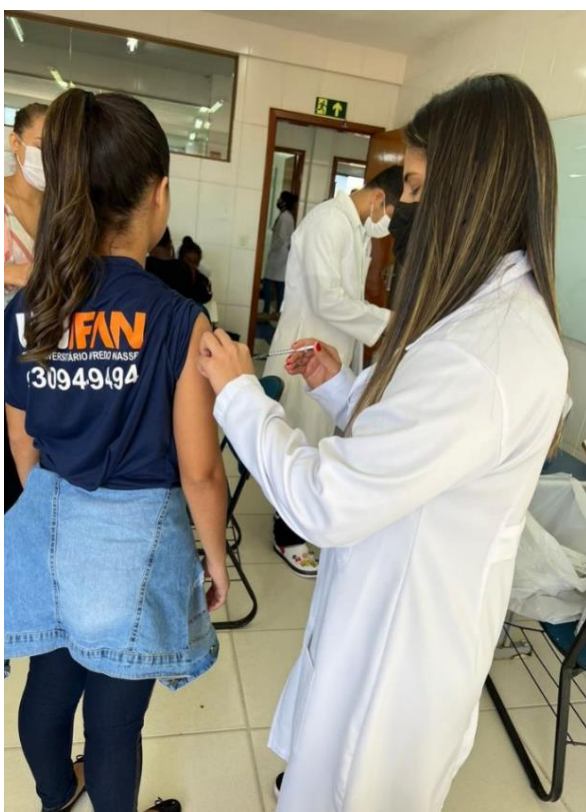
Figuras – Fotos da atuação dos estudantes no ‘Unifan Social’

As imagens a seguir são fotos autorais, referentes às atividades realizadas pelos alunos no evento ‘Unifan Social’, realizado nos dias 24 e 25 de junho de 2022, nas dependências do Centro Universitário Alfredo Nasser.