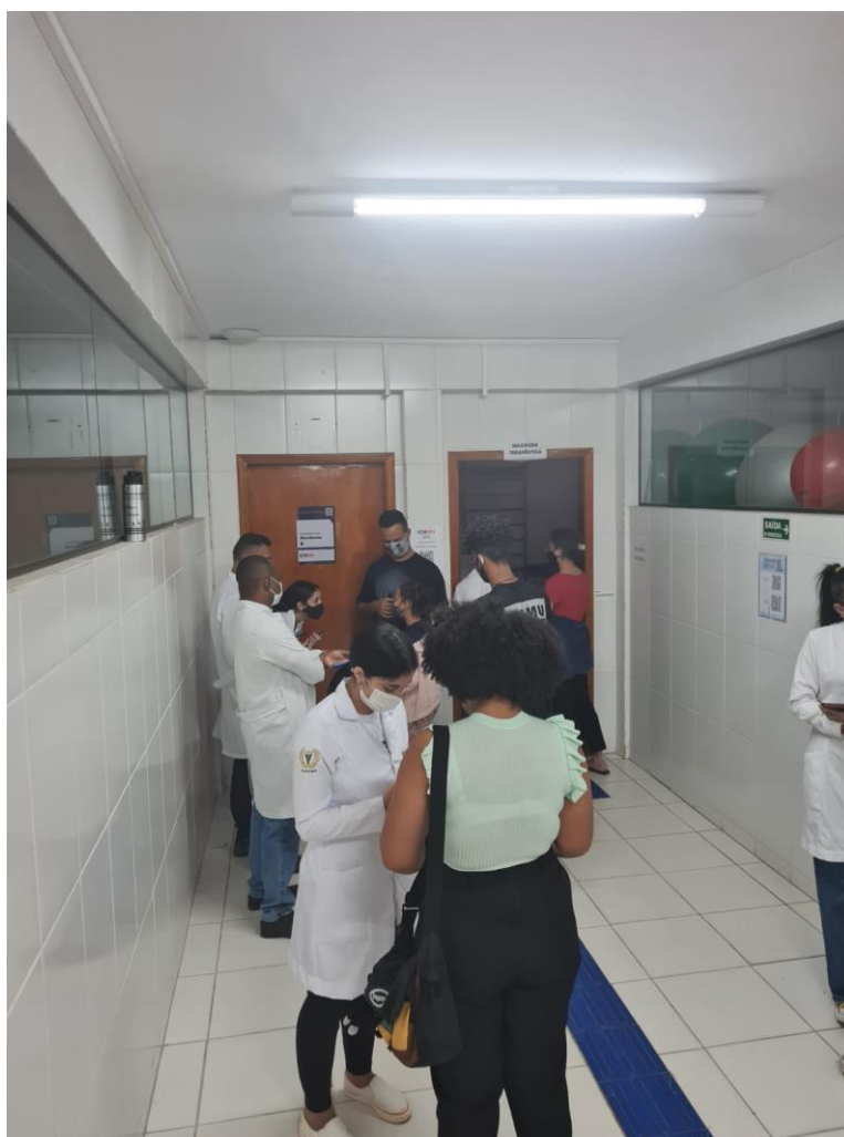
Figura 1 – Coleta inicial dos dados

Assim sendo, a sala de espera (Figura 1) representou o primeiro cenário de contato com os visitantes, apresentação e preenchimento do TCLE, enquanto a aplicação do protocolo de atendimento utilizou as macas e demais estruturas do laboratório de Eletrotermofototerapia - integrante da clínica escola da instituição (Figura 2).