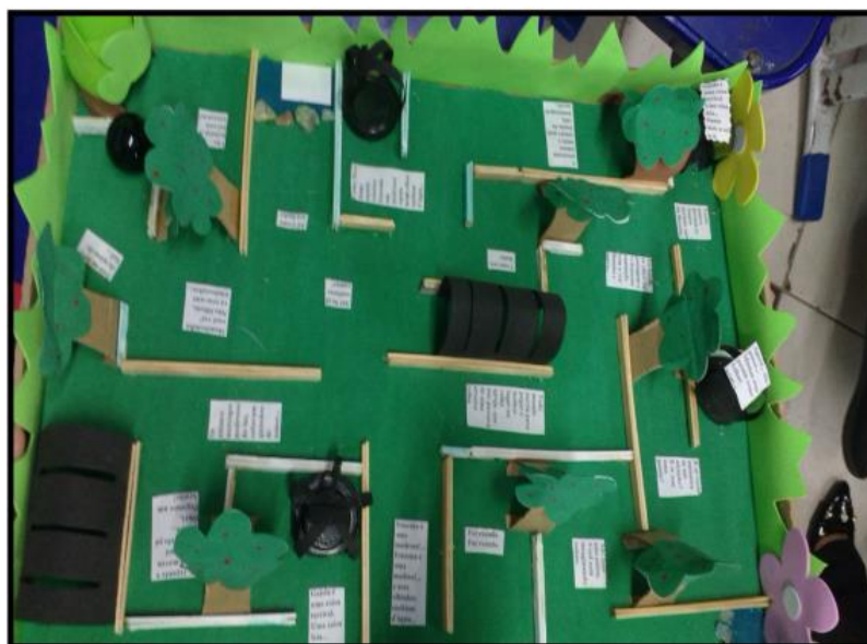
Figura 3 – Jogo confeccionado com material reciclável