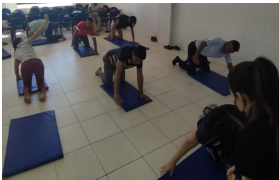
Figura 5 - Alunos e convidados realizando os exercícios do Yoga