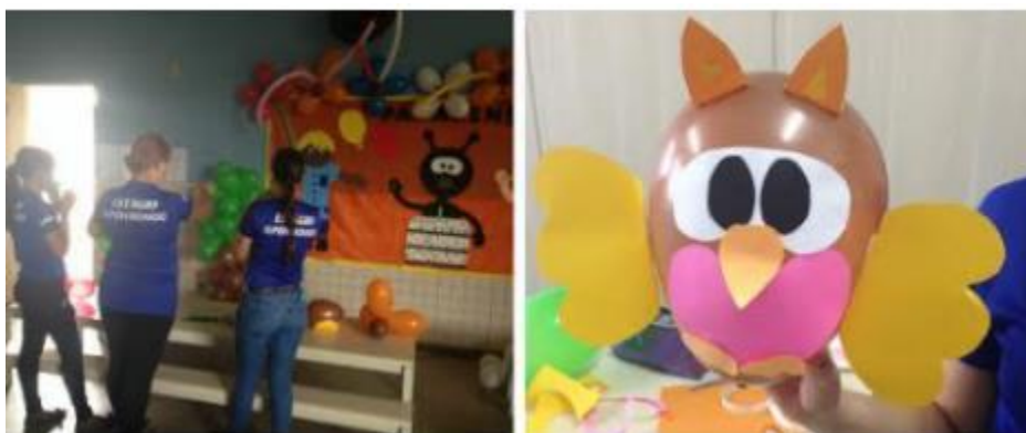
Figura 1 – Coleta dos dados e confecção do material

Parafrazeando Gadotti (2005), uma cultura da sustentabilidade é uma cultura da planetaridade, isto é, que parte do princípio, segundo o qual a Terra é constituída por uma comunidade de humanos, os terráqueos, que são cidadãos de uma única nação. Eis que torna-se essencial neste contexto desenvolver materiais com peças recicláveis por meio das quais é possível evitar o desperdício e o descarte irresponsável.