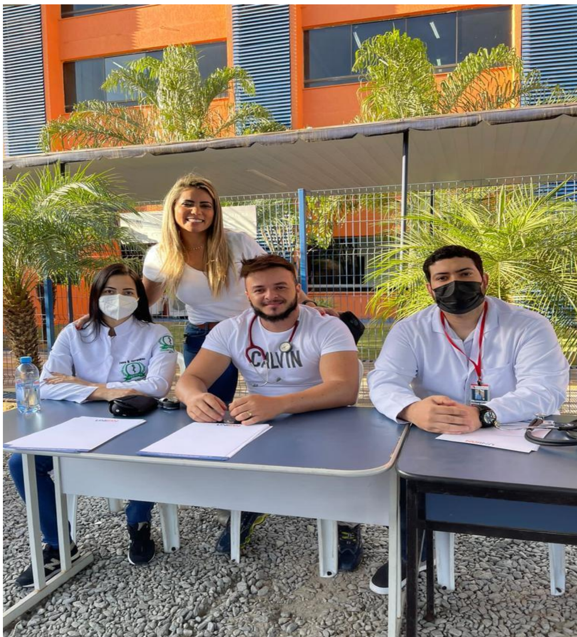
Figuras – Fotos da atuação dos estudantes no ‘Unifan Social’

As imagens a seguir são fotos autorais, referentes às atividades realizadas pelos alunos no evento ‘Unifan Social’, realizado nos dias 24 e 25 de junho de 2022, nas dependências do Centro Universitário Alfredo Nasser.