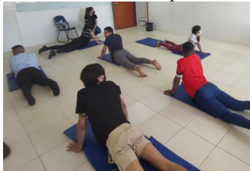
Figura 3 - Relaxamento com postura do Yoga