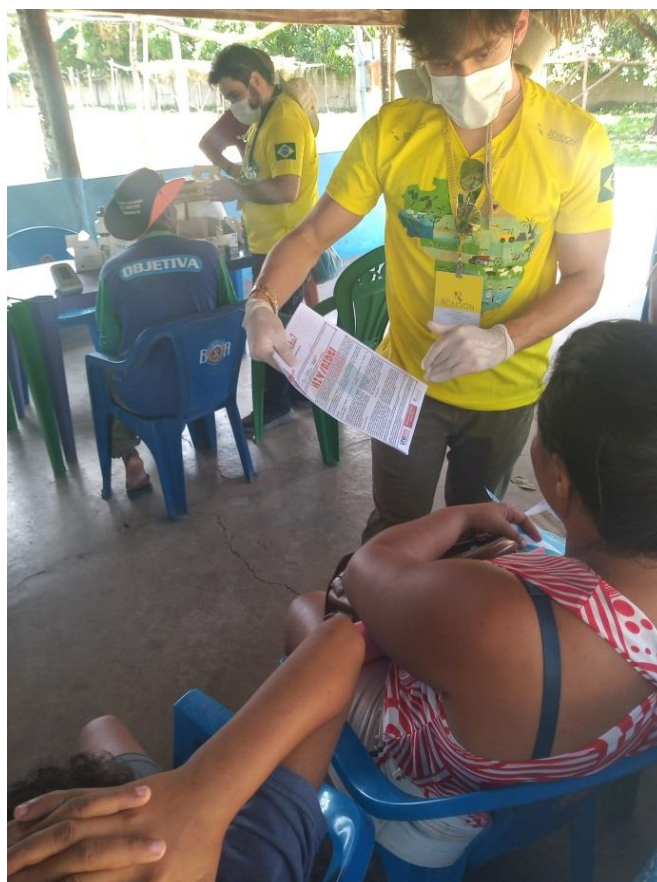
Figura 1 – Ação do Projeto Rondon em Nova Roma

participativa, para atender aos objetivos da mencionada Agenda 2030 para o Desenvolvimento Sustentável da ONU. Com isso, tivemos uma equipe multi e interdisciplinar envolvida com as principais etapas da prática extensionista, o que implica na formação de estudantes como sujeitos engajados nas grandes questões contemporâneas, tal como preconizado na referida Política Nacional de Extensão Universitária. É nessa direção que a Agenda 2030 das Nações Unidas preconiza a transformação da realidade local (ONU, 2015)